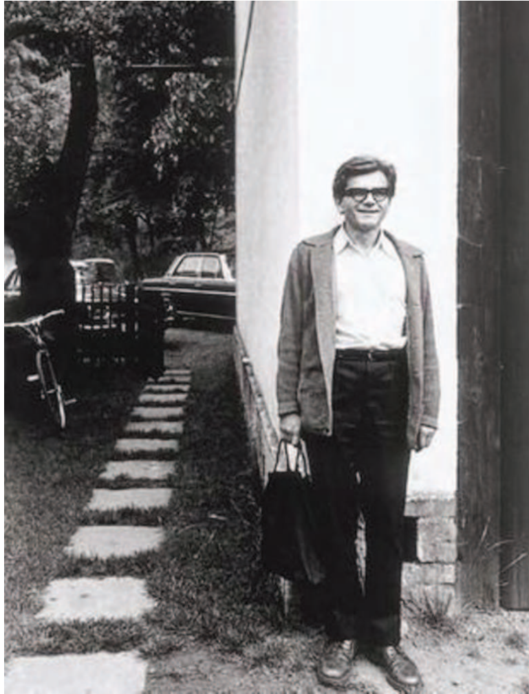
Karel Kosik (1926-2003).

Kosik 1949'da Prag'a döndüğünde, üniversitede önemli değişiklikler olmuştu. Çekoslovakya'da 1948 yılında başlayan "temizlik" hareketi askeri ve sivil bürokrasinin yanında üniver-