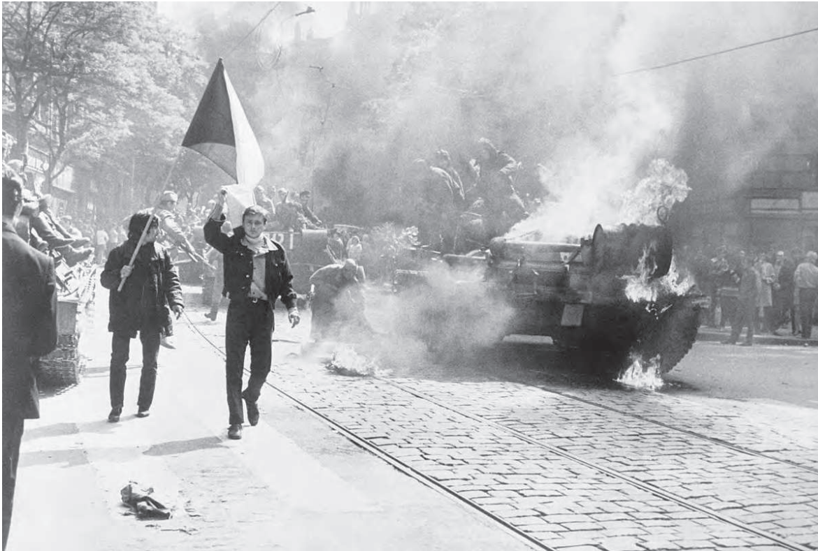
Prag Baharı'nda protestocu gençler.

nüştüremeyecekleri adeta doğal bir gerçeklik olarak algıladılar. Gerçeklikle ilişkilerini bilim ve teknoloji ile sınırlı olarak geliştirmeleri de "sahte somut"a ilişkin yanılgılarını aşmalarını engeller. Kosik'e göre diyalektik, insanların, gündelik yaşamda ortaya çıkan yapıların doğal nitelik taşımadığını, kendi faaliyetleri sonucunda oluştuğunu anlamalarını ve onu dönüştürmelerini sağlar. Dolayısıyla diyalektik düşünüş hakikatin gerçekleştirilmesidir. Kimi düşünce tarihçilerine göre Kosik'in gündelik yaşam eleştirisi ve bilimsel yöneme olan mesafeli yaklaşımı onun Heideggerci bir yaklaşım geliştirdiği anlamına gelir. Ancak Kosik'in temel ilham kaynağının Heidegger değil, Lukács olduğunu söylemek mümkündür. 12 Gerek Lukács, gerekse Heidegger 1920'li yılların ilk yarısında eserlerinde benzer sorunsalları işlemişler, "şeyleşme" üzerinden var olan toplumu eleştirmiş ve özne-nesne arasındaki ilişkilerin yeniden tarif edilmesi gerektiğini düşünmüşlerdir. Buna karşılık Lukács incelemesini ve çözüm yollarını Hegel felsefesi ve Marksizm üzerinden kurmuş, gerçekliği ve özne-nesne ilişkisini diyalektik yöneme başvurarak tarif etmiş ve toplumsal gerçekliğin ilişkisel bütünlüğünü vurgulamıştır. Heideg-