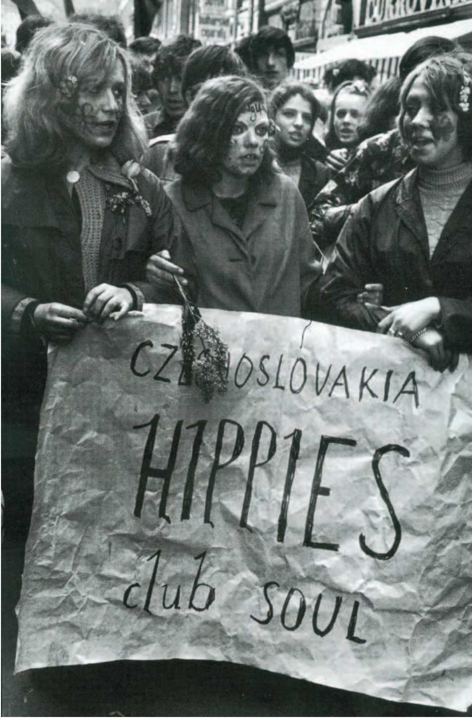
1 Mayıs günü Prag'da gençler.

1968 Magnum throughout the world (İspanya: Hazan, 1998), s. 63.