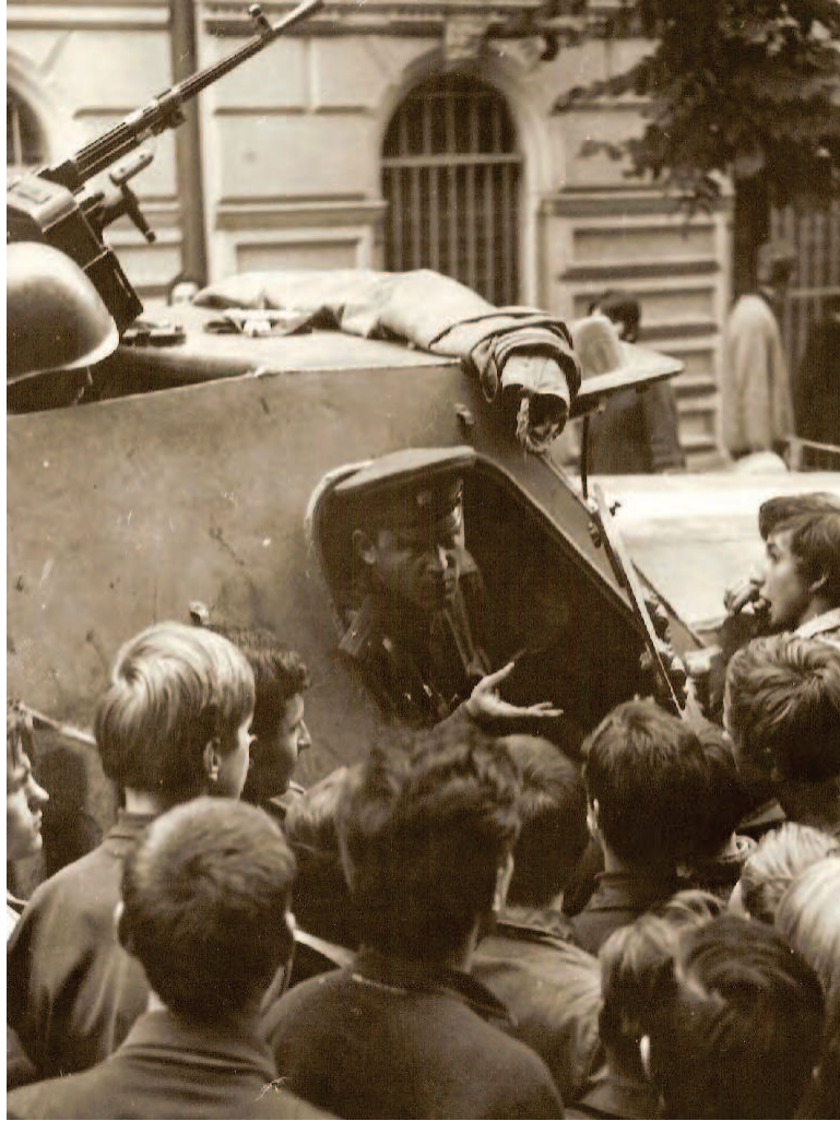
Siviller Sovyet tanklarının önünde.

Kosík bu dönemde yaptığı çalışmalarda kitleler ve bürokratlar arasındaki ayrım üzerine yoğunlaştı. Literárnílisty (Edebi Sayfalar) dergisinde Nisan-Mayıs 1968'de "Şimdiki Krizimiz" başlığı altında yayımladığı